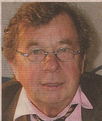
Hellmuth Karasek kommt nach Salzhausen ...